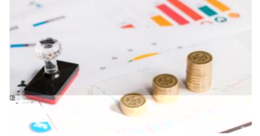
初始投资合伙企业涉税处理分析表